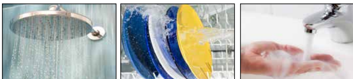
Tabla de Rendimiento